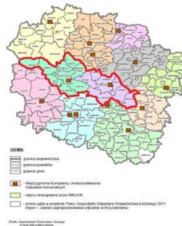
PROGRAM OCHRONY ŚRODOWISKA Z PLANEM GOSPODARKI ODPADAMI WOJEWÓDZTWA KUJAWSKO-POMORSKIEGO 2010 KIERUNKI Rys. 20 Międzygminne kompleksy unieszkodliwiania odpadów komunalnych

Ponad 305 tys. ton odpadów komunalnych rocznie